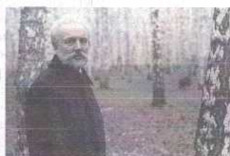
В фильме «Чайковский» И. Таланкина