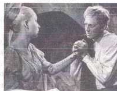
В фильме «Гамлет» Г. Козинцева