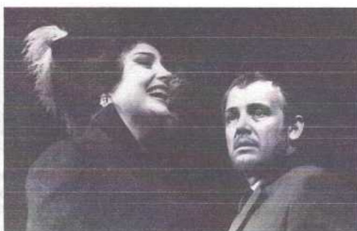
В роли князя Мышкина в спектакле «Идиот»