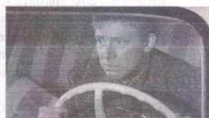
В фильме «Берегись автомобиля» Э. Рязанова