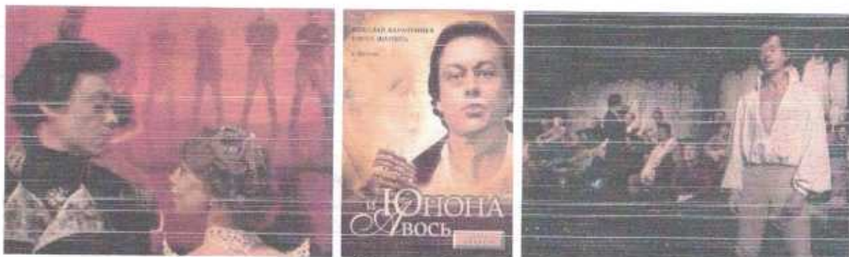
«Юнона и Авось»