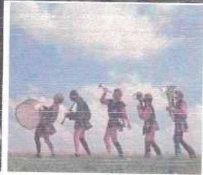
«Формула любви» и портрет М.А. Захарова