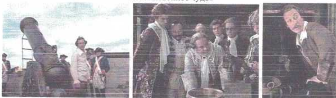
«Тот самый Мюнхгаузен»