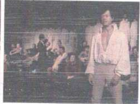
«Юнона и Авось»