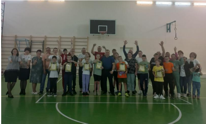
«Я как папа, сильный самый!»