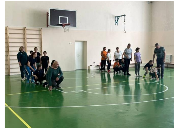
«Папа, мама, я – спортивная семья»