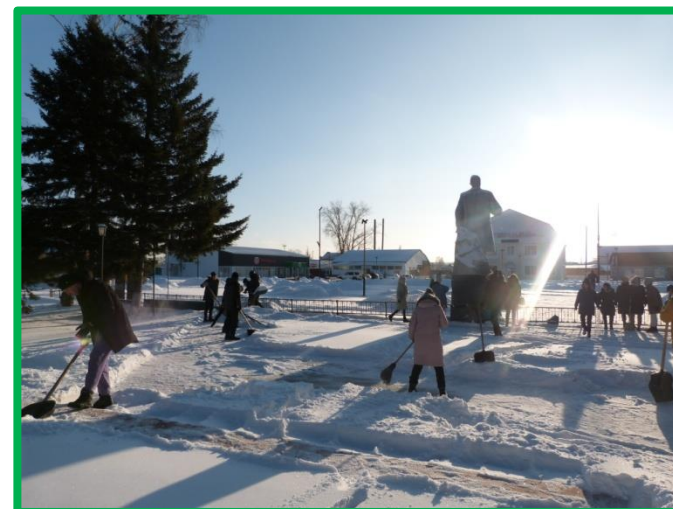
Благоустройство и чистка памятника п. Нижняя Пойма.