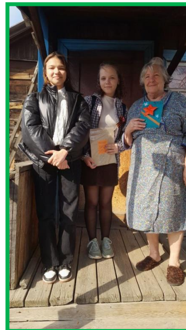
Акция «Дети войны»