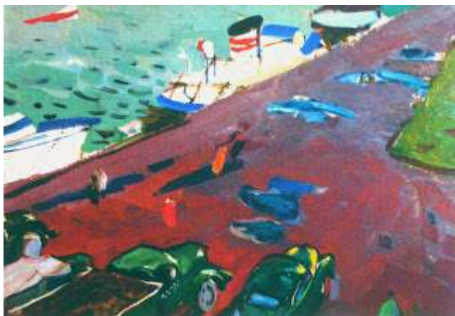
Поздеев А. Красноярск. Набережная