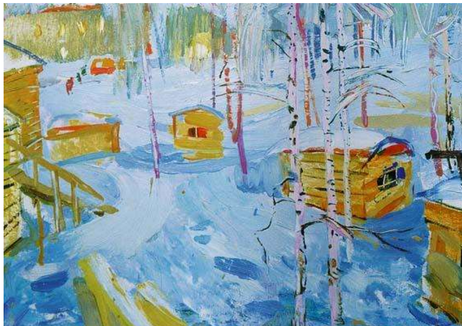
Поздеев А.Г. 1962 Дивногорск строится